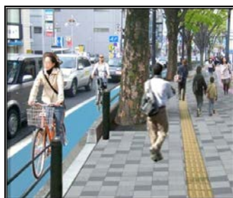
自転車レーンと植樹ます