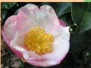
サザンカ・明石湯(C6)