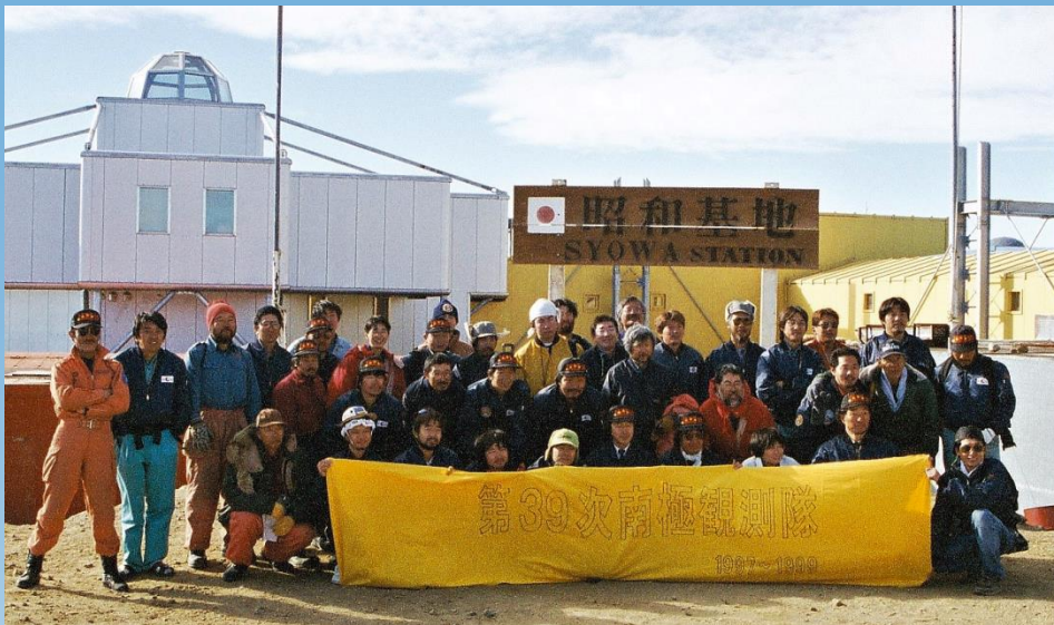
『第39次南極地域観測隊』(1997年)の一同