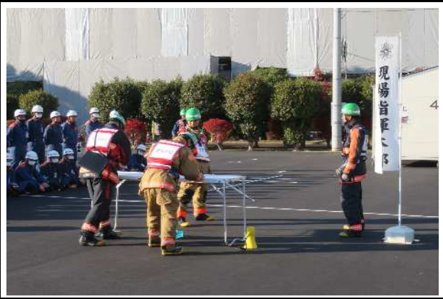
災害現場の指揮(訓練展示)