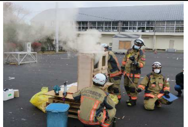
消火戦術と安全管理3