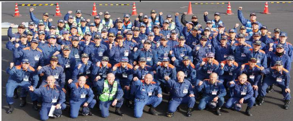
埼玉県はひとつ！！スローガンは「ワンチーム！！」