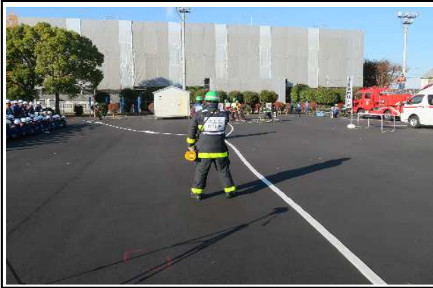
災害現場の指揮(訓練展示)