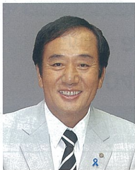
埼玉県知事 上田 清司