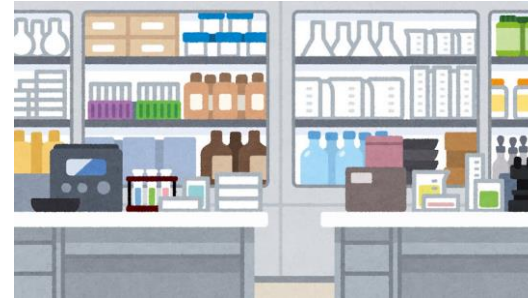
室内土質試験作成