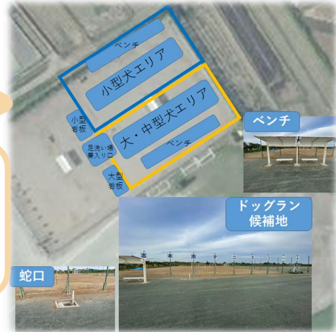
ドッグラン完成イメージ図