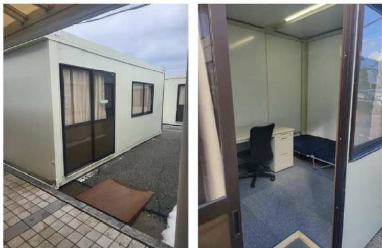
仮眠が取れるコンテナの設置