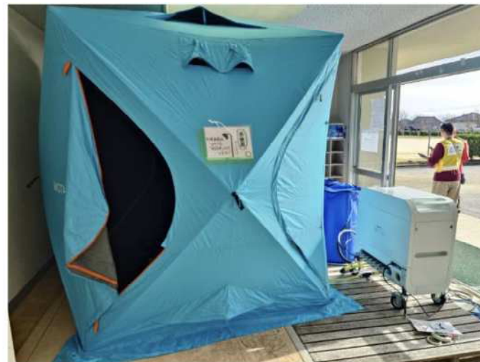
水循環システム付きシャワーキットの手配

狭いコミュニティでは、避難所内でも「行政職」であることが求められ、休むことができない