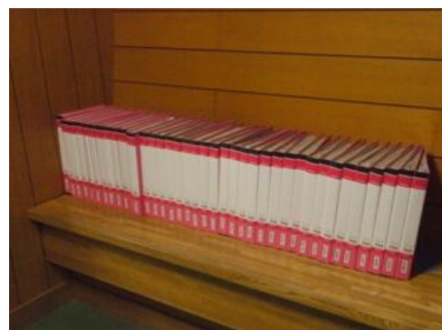
[ 図4 家庭学習用ファイル ]