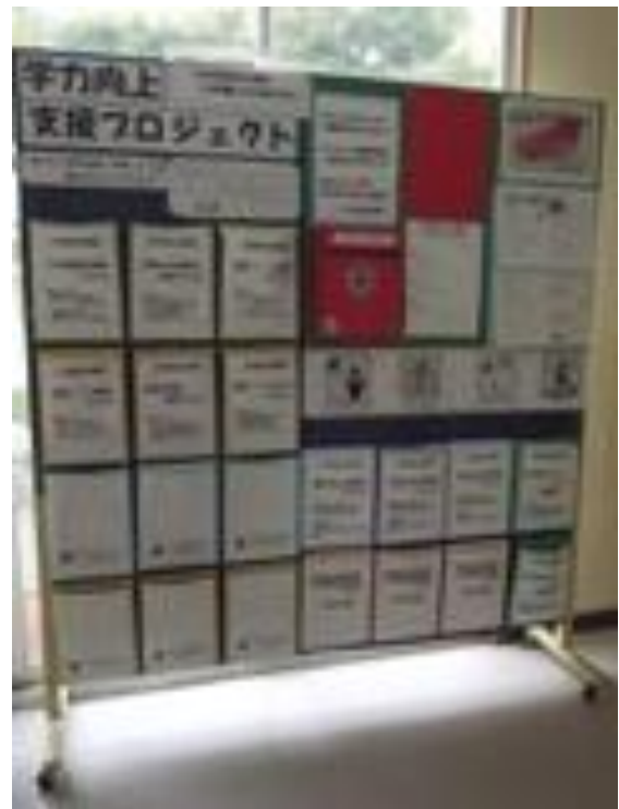
[ 図2 ばっちりシート 掲示 ]