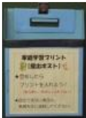
[ 図3 家庭学習用ポスト ]