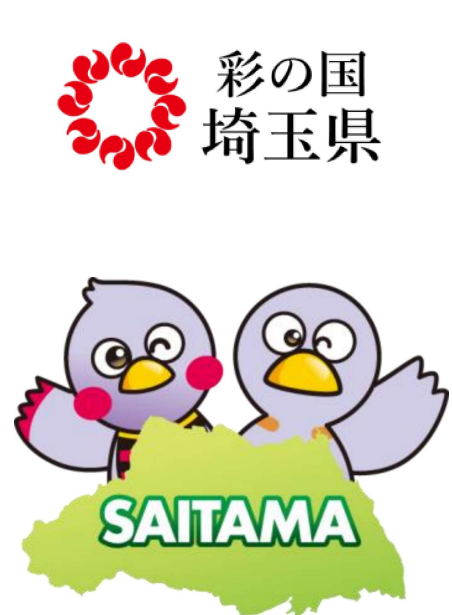
埼玉県マスコット さいたまっち&コバトン

県が作成する広報印刷物には、原則として以下の4点セットをバランスよく入れてください。