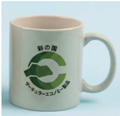
彩の国サーキュラーエコノミー型製品ロゴ