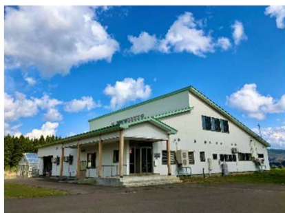
白神研究所 (秋田県藤里町)