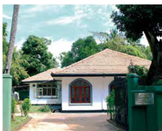
スリランカ伝統植物研究所 (スリランカ)