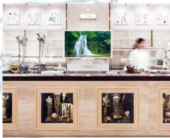
横浜研究室 (ALBION PHILOSOPHY LAB)