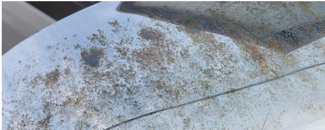
○車のサイドミラー