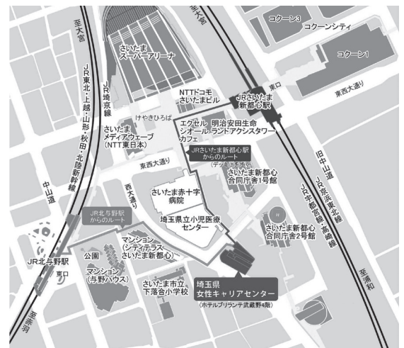
JRさいたま新都心駅 徒歩5分/北与野駅 徒歩6分 ※利用者様用の駐車場はございませんのでご了承ください。

おしごと相談のほか、各種イベント、セミナー、求人検索、求人紹介など多数のメニューをご用意しております。