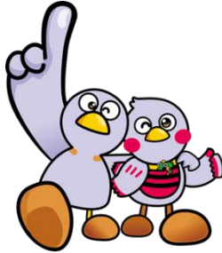
こばとん さいたまっち コバトン さいたまっち

さいたまっちは、平成26年11月14日(県民の日)に誕生したマスコット。「くりくりおめめ」と「お腹のボーダー」がトレードマーク。コバトンと一緒に埼玉県を全力でPRしています。