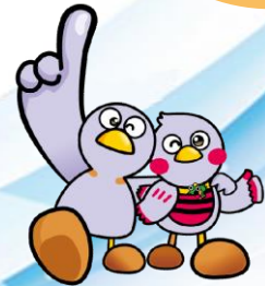
埼玉県マスコット 「コバトン&さいたまっち」