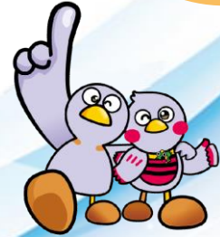
埼玉県マスコット 「コパトン&さいたまっち」