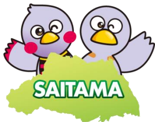
埼玉県マスコット さいたまっち&コバトン