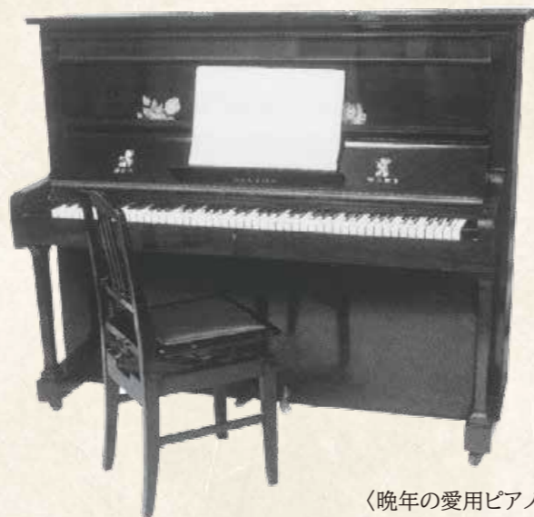
〈晩年の愛用ピアノ〉

また、箏の曲、三味線の曲など日本の伝統音楽についても作曲し、その数2,000曲とも3,000曲とも言われています。