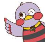
埼玉県マスコット 「さいたまっち」

埼玉县，为了对上高中的学生给予支援，制定了学费减轻制度、无利息奖学金贷款等许多修学支援制度。