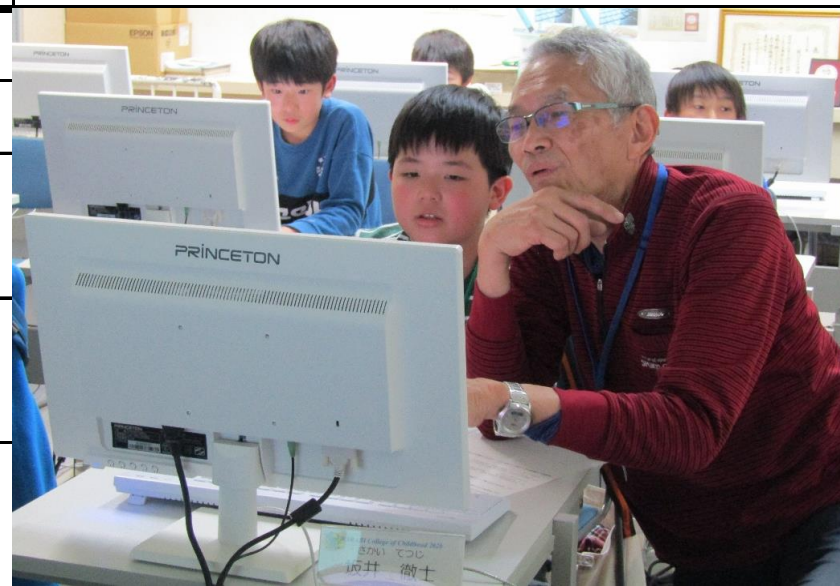
プログラミングを覚えてもらう様子