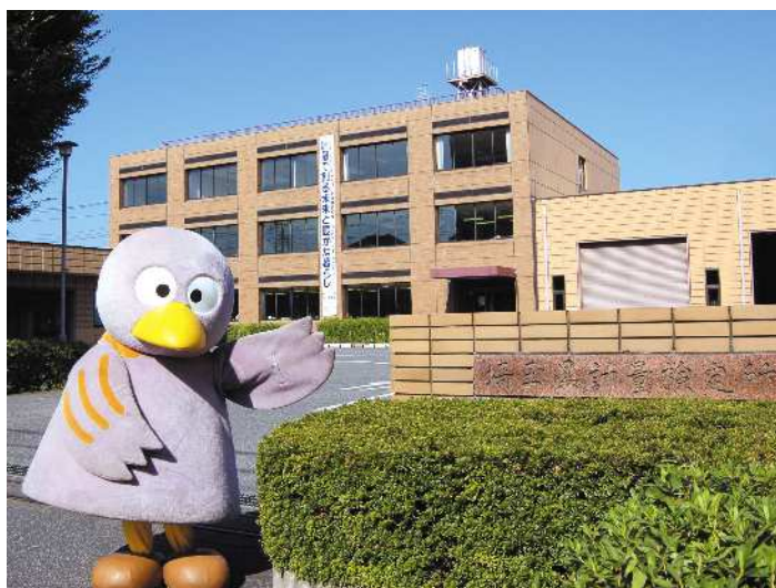
計量検定所現庁舎と埼玉県マスコット「コバトン」