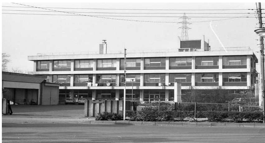
計量検定所旧庁舎

平成22年 行政組織規則の改正（4月1日）に伴い、立入検査・登録指導担当、検査検定担当の2担当制となった。