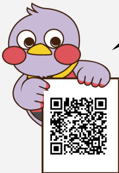
埼玉県マスコット 「さいたまっち」