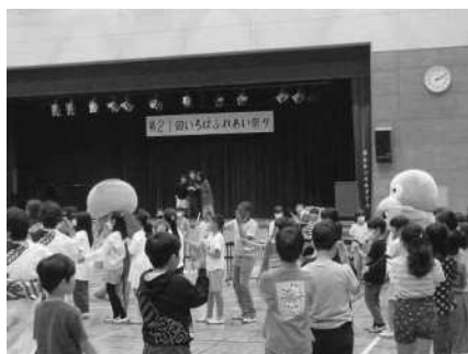
いろはふれあい祭りで婦人会と子どもが「志木音頭」を踊る様子

小学校の委員会活動で、子どもたちがいろは遊学館の玄関を季節の絵や折り紙で飾り、いろは遊学館利用者の目を楽しませている。高齢者にとって、昔懐かしい折り紙や1年の行事の子どもたちの絵は、心を和ませてくれている。