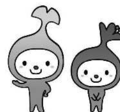
和光市イメージキャラクター 「わこうっち」「さつきちゃん」