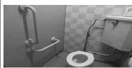
ア 手すりつきトイレ