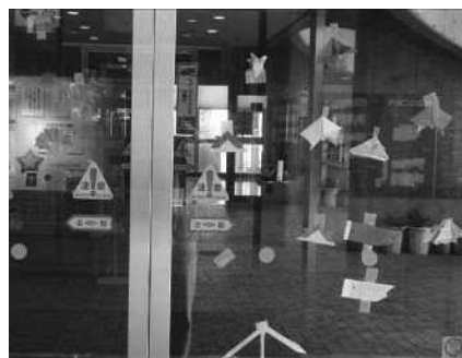
ジュニア委員会で作成された折り紙で飾られたいろは遊学館の入口