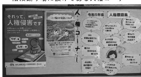
階段踊り場に設けてある人権コーナー

私と同和教育との出会いは、新採用として赴任した中学校で同和教育主任を拝命した時だった。社会科教員としてある程度の知識はあったが、主任となると不安は大きかった。しかし、その不安を取り除いてくれたのが、同和教育に熱心に取り組む先輩の姿と現地研修に参加した時に助言をいただいた指導者の方であった。実際に残る部落史の事実を目の当たりにしてこの事実を生徒にどのように伝え、差別を許さない人権感覚をどう育むのかが私の社会科教員としての研究テーマのひとつになった。