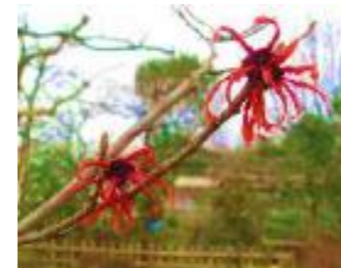
アカバナシナマンサク