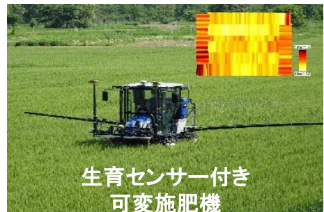
生育センサー付き 可変施肥機