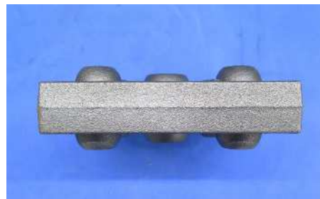
ボス付角ベース 横