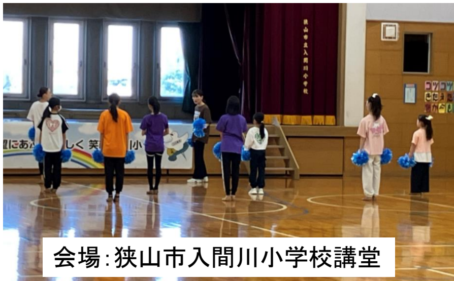
会場：狭山市入間川小学校講堂