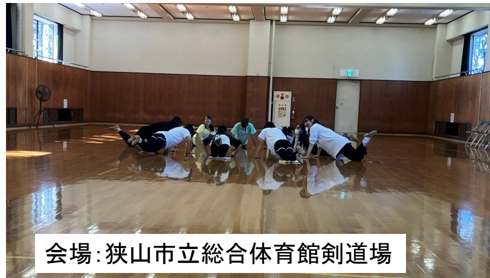
会場：狭山市立総合体育館剣道場