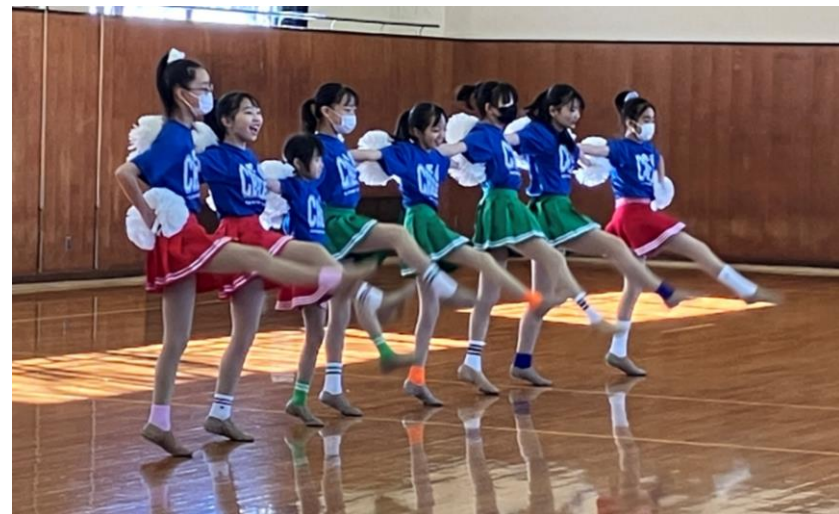
ウェアを着て発表会前々練習