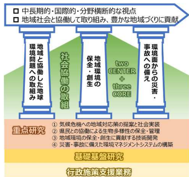
研究の方向性、柱と構成

特に重要性・喫緊性の高い環境課題に領域・グループを横断して取り組み、下記の「④ 社会協働の取組」を通して、