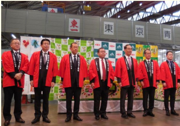
トップセールス(イメージ)