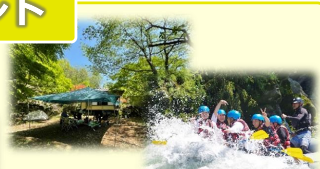
貸切キャンプ&ラフティングツアー