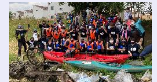
カヌーでの清掃活動