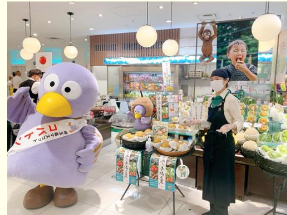
第1弾のフェアの様子(フレッシュワン大丸東京店)

場所:フレッシュワン大丸 東京店、サンフレッシュ高島屋 新宿店・玉川店、万英プロデュース(中央区新川)