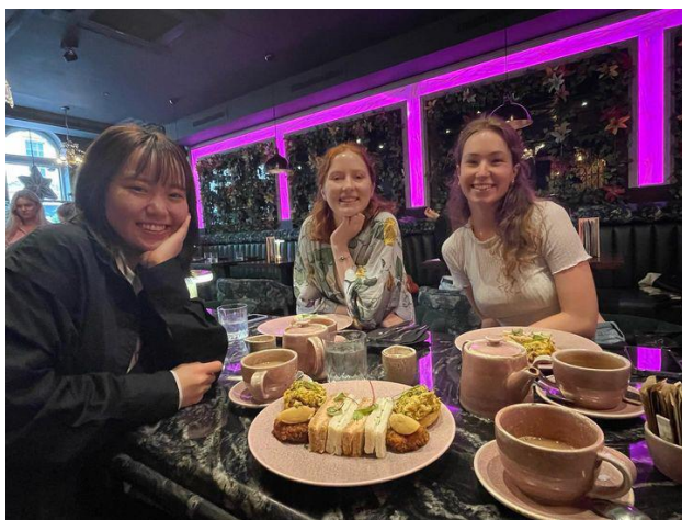
↑ 現地の友達とアフタヌーンティー

ニューカッスルはスコットランドの近く、イングランド北東部に位置しています。現地の人々は「ジョーディー」と呼ばれ、方言やアクセントが強いことで知られているため、留学前はジョーディー英語を理解できるか不安でした。しかし、町の人々は優しく安心して過ごせ、ローカルの文化を味わえる貴重な経験になりました。また、国際色豊かで、日本ではなかなか出会う機会の少ない国籍の人々と交流しました。個人的にはインドネシア人、マレーシア人、中国人、香港人と関わることが多かったです。仲良くなった人と政治的な話など深い話までし、調べるだけではわからないことまで知ることができ、自分の価値観が大きく変わりました。