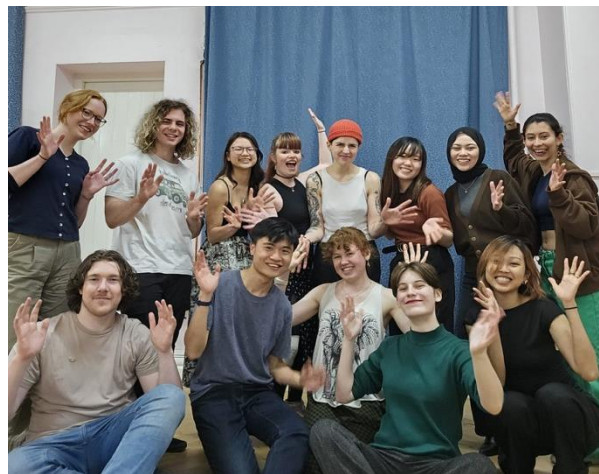
↑ 所属していた Swing Dance Society のみんな