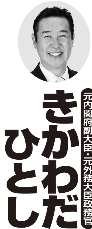
元内閣府副大臣・元外務大臣政務官