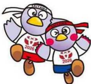
コバトン&さいたまっち