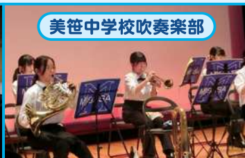
美笹中学校吹奏楽部