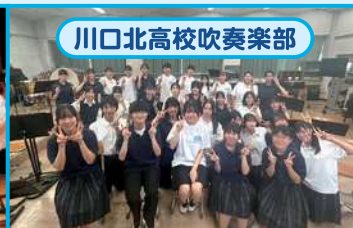
川口北高校吹奏楽部