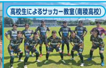
高校生によるサッカー教室(南稜高校)