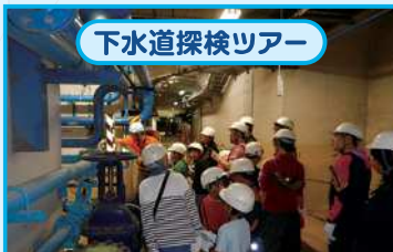
下水道探検ツアー