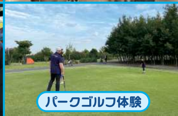
パークゴルフ体験