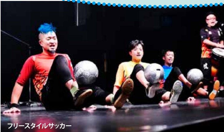
フリースタイルサッカー