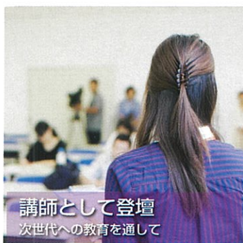
講師として登壇 次世代への教育を通して