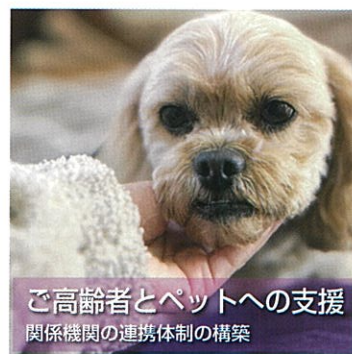
ご高齢者とペットへの支援 関係機関の連携体制の構築