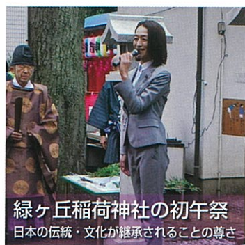
緑ヶ丘稲荷神社の初午祭 日本の伝統・文化が継承されることの尊さ