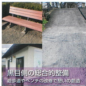
黒目側の総合的整備 遊歩道やベンチの改修で憩いの創造