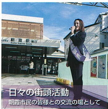
日々の街頭活動 朝霞市民の皆様との交流の場として