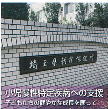
小児慢性特定疾病への支援 子どもたちの健やかな成長を願って