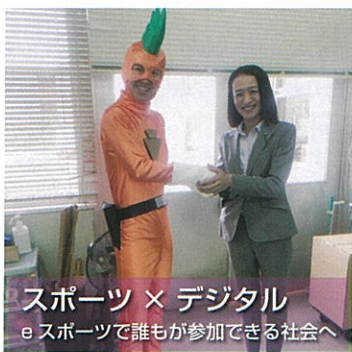
スポーツ × デジタル e スポーツで誰もが参加できる社会へ