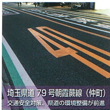
埼玉県道 79 号朝霞蕨線 (仲町) 交通安全対策、県道の環境整備が前進