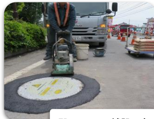
ERアスコン舗設・転圧