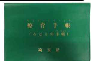
療育手帳(みどりの手帳)