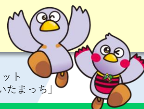
埼玉県マスコット 「コバトン」&「さいたまっち」