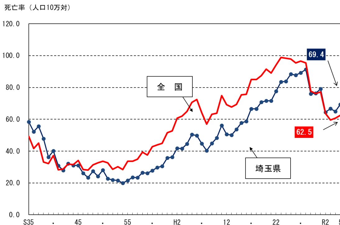
図－11 肺炎による死亡率の年次推移（埼玉県・全国）