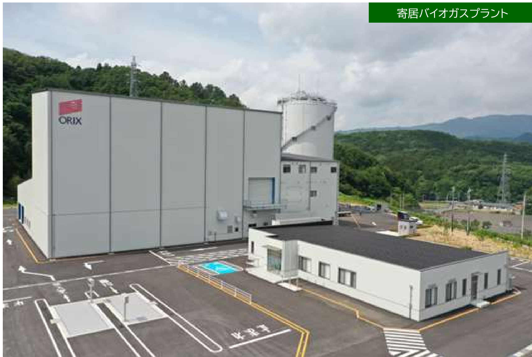
寄居バイオガスプラント