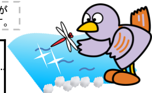
埼玉県のマスコット「コバトン」