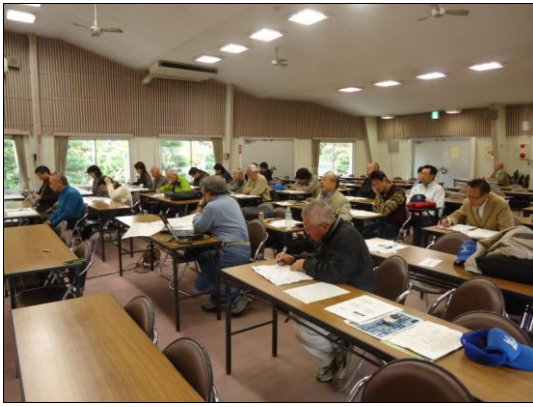
意見交換の様子(東松山市)

残念なことは、質疑応答と交流の時間が少なかったことでした。地域で集まるということは、場所が近い(参加団体は東武東上線沿線の団体が多かった)だけに、今後の団体同士の交流も期待でき、来年度以降も地域交流会を継続して実施していく予定です。