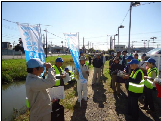
「五感による河川環境指標」を用いて大場川を観察している様子(三郷市)