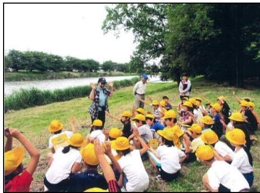
よみがえれ元荒川の会(蓮田市)による環境学習の様子

県では、川の国応援団を中心とした団体同士の「共助による川の再生」を推進するため、団体情報の発信や情報共有などの支援を行っています。