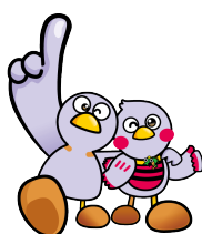
埼玉県のマスコット

(注) さいたま市、川越市、越谷市、熊谷市、川口市、所沢市、春日部市、草加市及び久喜市は各市役所へお問い合わせください。