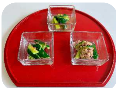
▲きゅうりのたたき和え