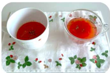
▲トマトのコンソメスープ

水分を「食べて」とりましょう! しっかり食べることで食事からも水分をとることができます