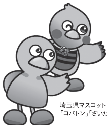
埼玉県マスコット 「コバトン」「さいたまっち」

右の正方形は音声コードといい、専用の読取機を利用して音声で内容を聞くことができます。