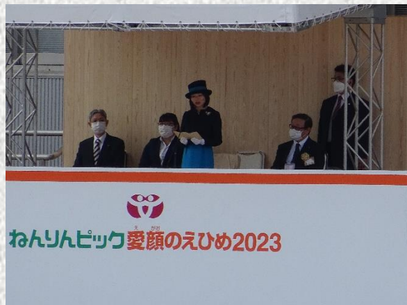
開会式 (三笠宮彬子女王殿下のおことば)