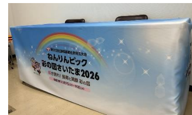
広報用テーブルクロス