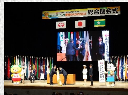
閉会式 (鳥取県知事への大会旗引継)