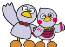
埼玉県マスコット 「コバトン&さいたまっち」