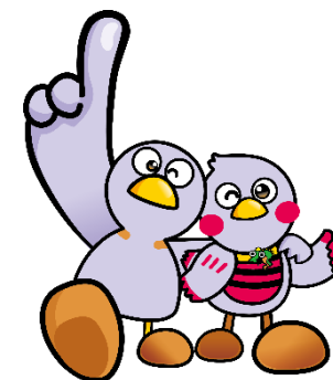
埼玉県マスコット コバトン&さいたまっち

令和7年度入試までの 部活動に関する記入箇所 （「3 特別活動等の記録」 の欄のその他）を 令和8年度入試は、 「5 その他」 の欄へ変更します。