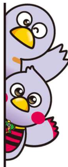
埼玉県のマスコット 「コバトン」「さいたまっち」